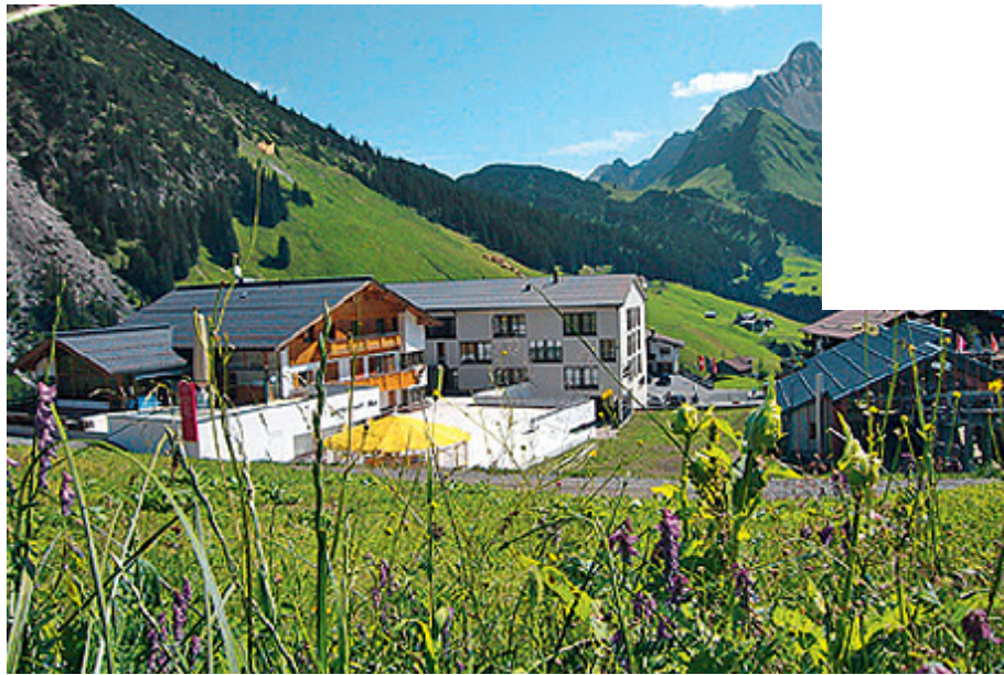
Spa des Monats